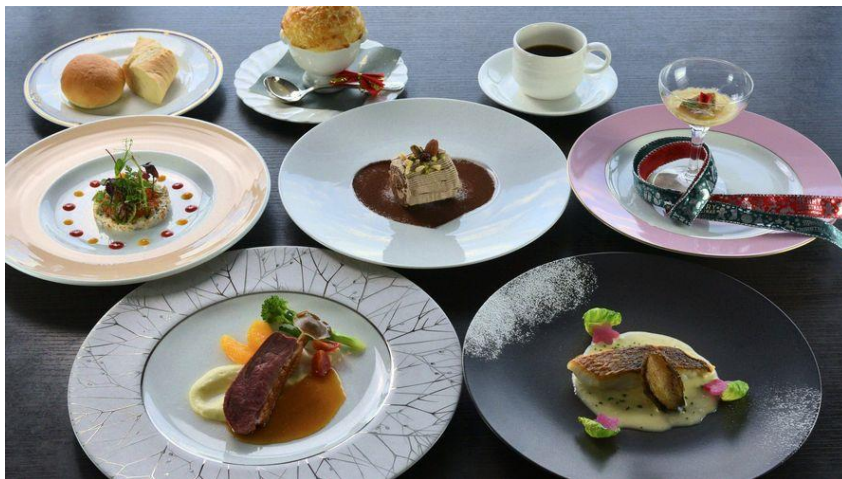
夕食:クリスマス創作フレンチ(イメージ)

当ホテルでのご滞在を通じて、心身をリラックスしていただくとともに思い出に残るクリスマスのひとときを提供いたします。