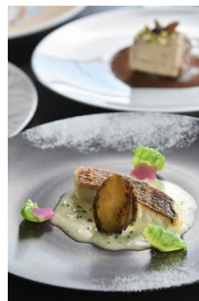
真鯛と鮑のポワレ 生姜香るバターソース

※当社のレストラン、宴会場等における食物アレルギー対応につきましては、食品表示法により製造会社等(当社の食材仕入先)に表示義務のある特定原材料7品目(えび・かに・小麦・そば・卵・乳・落花生)のみとさせていただきます。特定原材料7品目の対応をご希望のお客さまは事前にお申し出ください。