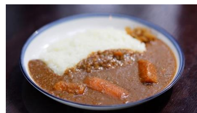
オリジナル森のカレー