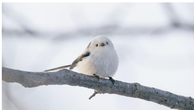
雪の妖精「シマエナガ」