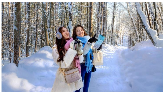
バードウォッチング体験

©本件に関する報道各位からのお問合せは 新富良野プリンスホテル セールス&マーケティング TEL: 0167-22-1118（直通）FAX: 0167-22-1189