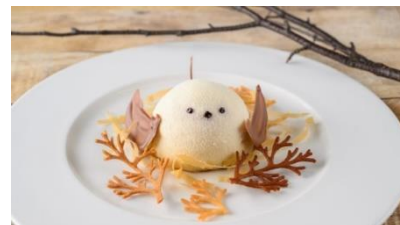
「シマエナガ」オリジナルケーキプレート