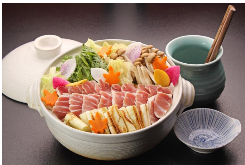
ねぎま鍋(イメージ)