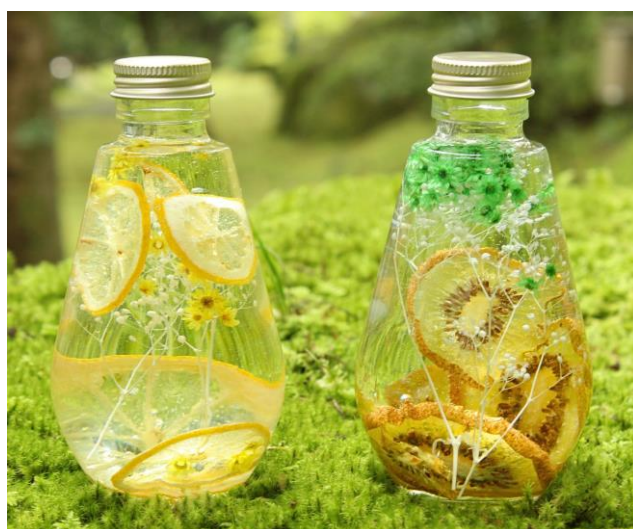
ハーバリウム(イメージ)

◎本件に関する報道各位からのお問合せは 箱根湯の花プリンスホテル 広報 TEL: 0460-83-5112(直通) FAX: 0460-83-6556 https://www.princehotels.co.jp/yunohana/