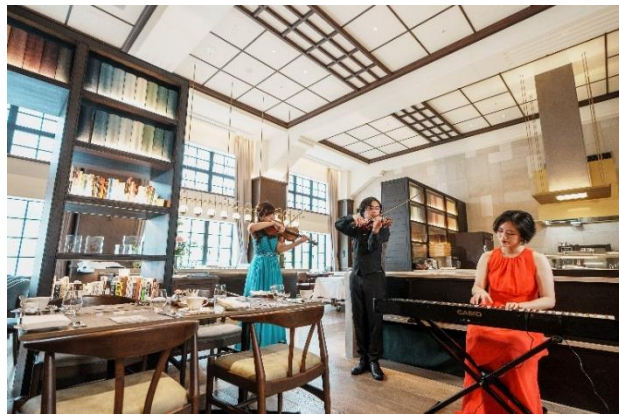
朝食レストランでの演奏