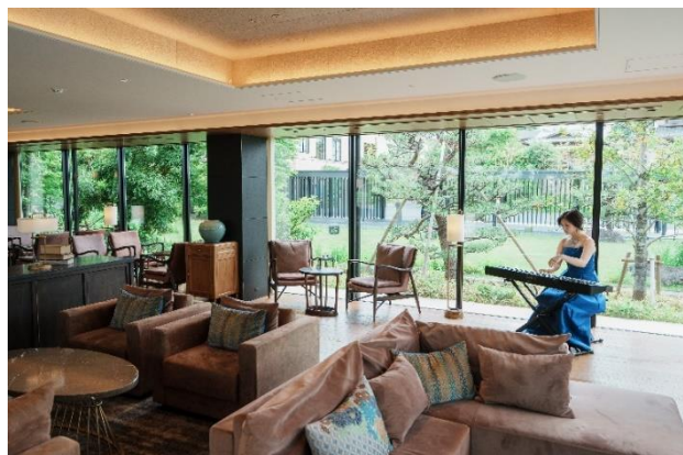
夕刻 ゲストラウンジでの演奏