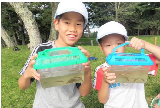
池にひそむ生き物大調査隊イメージ