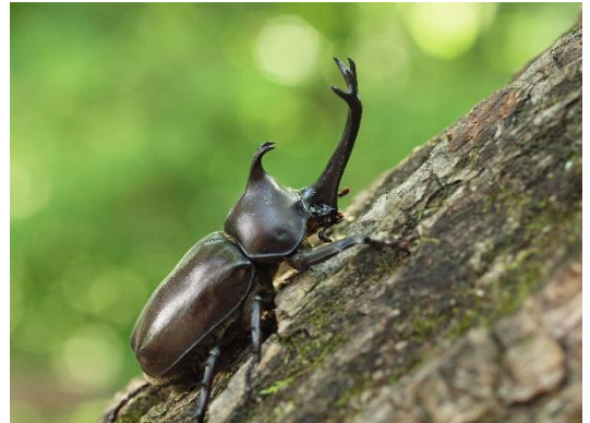
特設ドーム「カブトムシの森」で暮らすカブトムシに出会える