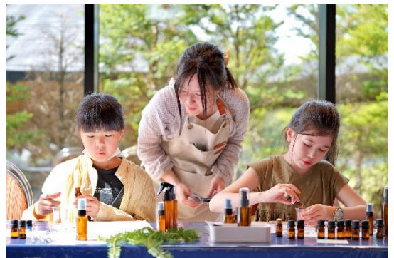
軽井沢蒸留香房 オリジナルアロマのイメージ