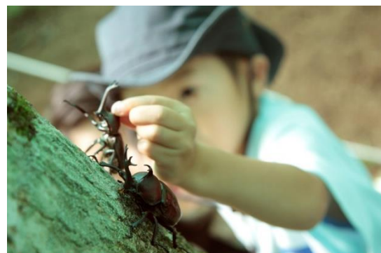
特設ドーム「カブトムシの森」で暮らすカブトムシに出会える

◎本件に関する報道各位からのお問合せ先 株式会社西武・プリンスホテルズワールドワイド 軽井沢地区 セールス&マーケティング TEL:0267-42-8115 (セールス&マーケティング直通) https://www.princehotels.co.jp/karuizawa-area/