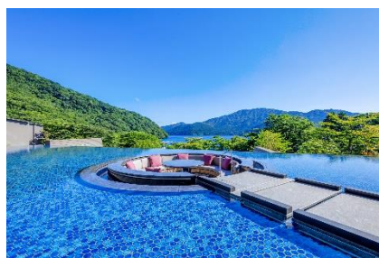
箱根・芦ノ湖 はなをり