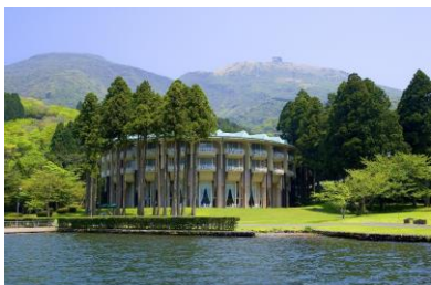
ザ・プリンス 箱根芦ノ湖