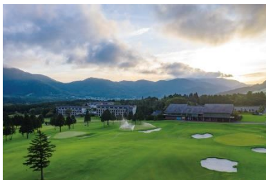
大箱根カントリークラブ