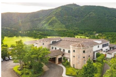
箱根仙石原プリンスホテル