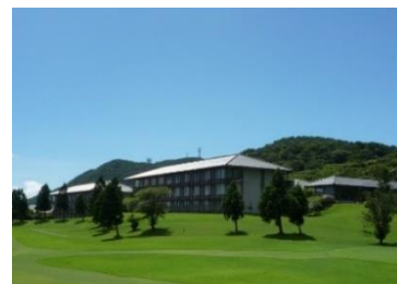
箱根湯の花プリンスホテル