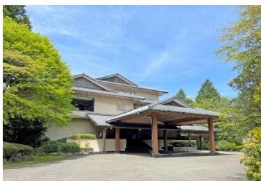
芦ノ湖畔 蛸川温泉 龍宮殿