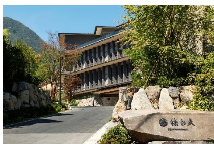
箱根・強羅 佳ら久