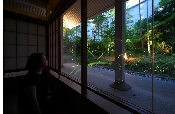
「日本料理 宝ヶ池」店内より中庭を臨む(イメージ)