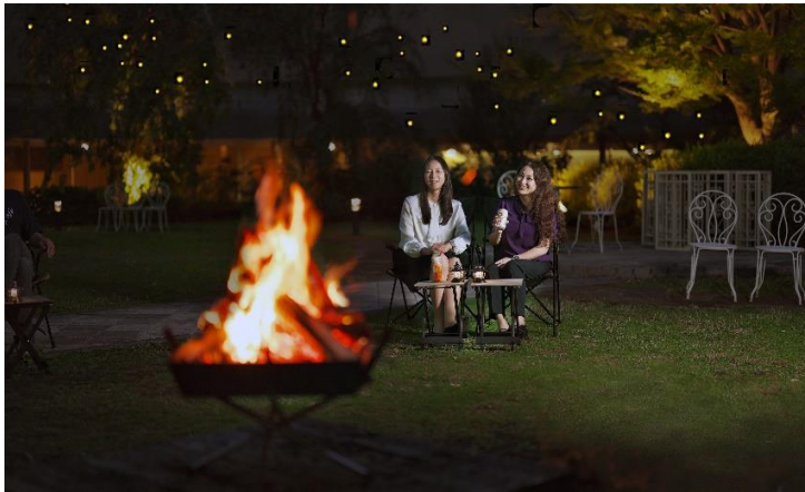
「ほたる鑑賞の夕べ」焚火ラウンジ(イメージ図)

ザ・プリンス 京都宝ヶ池では、自然に恵まれた環境を活かし、お客さまの心に残る季節感あふれる体験を今後も提供してまいります。