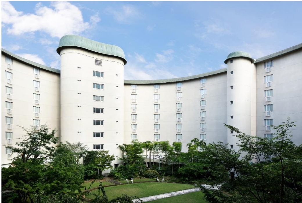
ザ・プリンス京都宝ヶ池 中庭