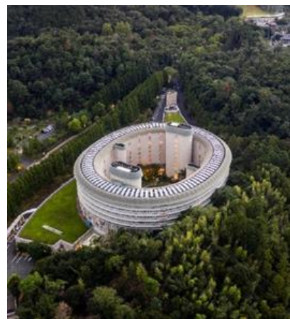
ザ・プリンス 京都宝ヶ池 全景

洛北の四季の自然とホテルをいかに融合させるかにこだわり、ホテル棟はもとより、ロビー、宴会場、客室のディテールにいたるまで曲線が多用された意匠は、訪れる人々を優しく包みます。ドーナツ型のホテルの中央にある中庭は、桜、紅葉のほか多種の草花が四季折々の風情をみせ、お客さまの散策の場としてお楽しみいただいております。