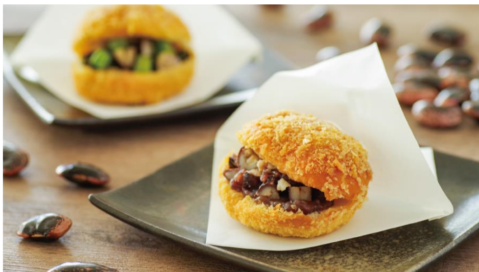
左奥「花豆揚げパン(野沢菜)」 右手前「花豆揚げパン(あんこ)」 写真はイメージです

万座温泉スキー場(所在地:群馬県吾妻郡嬭恋村万座温泉 総支配人:塚本亨)は、2023年12月23日(土)より2023-2024シーズンの営業を開始に伴い地元嬭恋村特産品の花豆を使った「花豆揚げパン」を販売いたします。