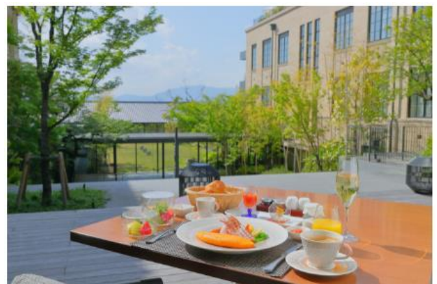
天気の良い日は野外テラス席もご利用いただけます。