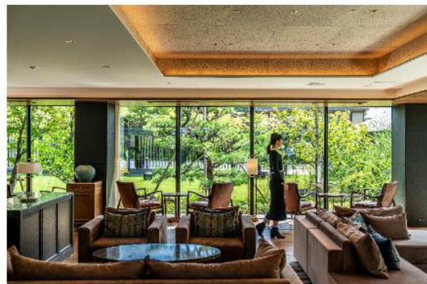
ゲストラウンジ内観