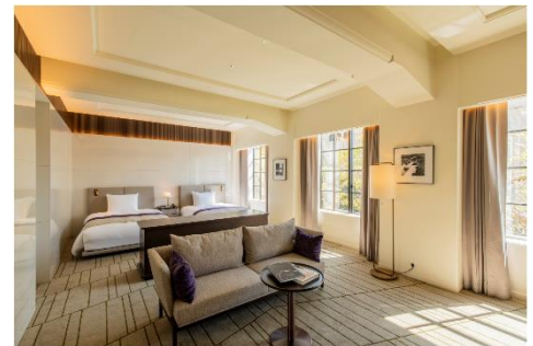
既存改修部客室 ジュニアスイート 66.3 m 2