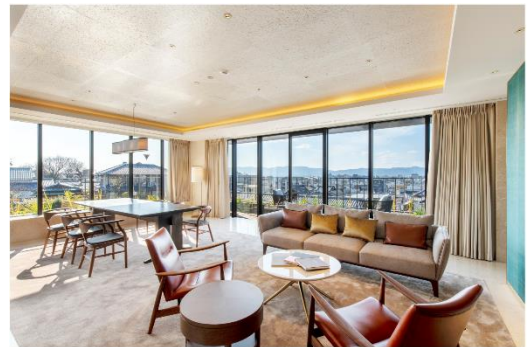
増築部客室 パノラミックスイート 136.3 m 2 (寝室・リビング)