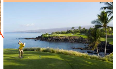
湾を超えて海側のグリーンに打つ 3 番ホール マウナ ケア ゴルフ コースの人気パー3