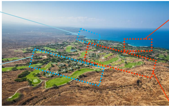
ハワイ島の山々と太平洋に囲まれた自然が魅力の 「マウナ ケア リゾート」