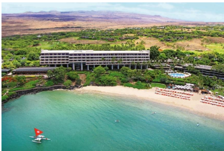
ハワイ島の山々と美しいカウナオア湾に囲まれた「マウナ ケア ビーチ ホテル」

このたび、全客室252室の改装、屋内外11のトリートメントルームを備えるスパおよびラッププール※1完備のフィットネス施設の新設、ハワイの自然を体験するキッズエリアの新設を含む大規模な改装を段階的に行い、開業60周年を迎える2025年春頃にリニューアルオープンを予定しております。美しい景観を損なわず、60年代にロックフェラー氏が築いたその遺産と伝統を尊重しながら、自然の中でのアクティビティや健康に対する意識が高い幅広い世代に向けたウェルネス施設を拡充することで、長く未来に渡り愛されるホテルを目指してまいります。