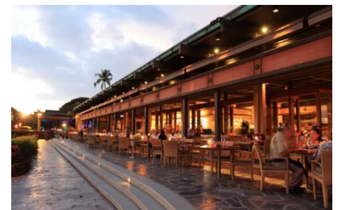
美しいカウナオア湾を望む ホテルを代表するレストラン「マンタ」

※上記内容は 2023 年 10 月 4 日現在のものであり、変更となる場合がございます。