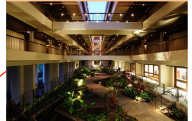
ハワイの自然との調和がとれた 吹き抜けのロビー空間