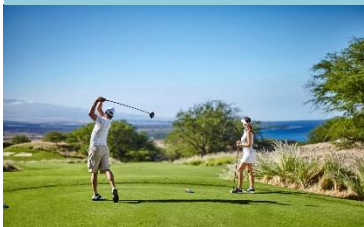
アーノルド・パーマー/エド・シェイ設計の 18 ホール・チャンピオンシップコース