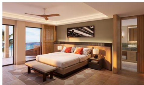
改装後のイメージ(タワースイート)