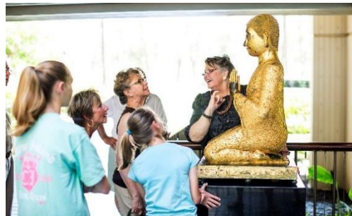
カルチャーアンバサダーチームによる カルチャープログラム