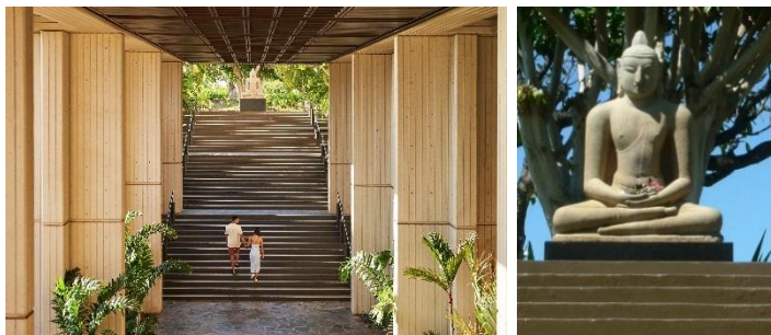
ホテル館内に美術品が並ぶ

大規模な改装にあたり、「マウナ ケア ビーチ ホテル」の土地と文化の保存とサステナビリティの取り組みとして、ホノルル ビショップ ミュージアムやその他の主要な地元パートナーと提携し、ロックフェラー氏が個人的に収集した百万ドル相当の美術コレクションの修繕、貴重なコレクションの保存、リゾート内の公共スペースへの展示を実施いたします。