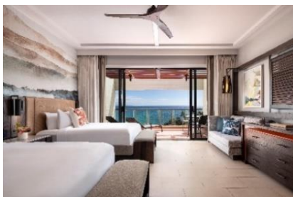
改装後のイメージ(オーシャンビュー)