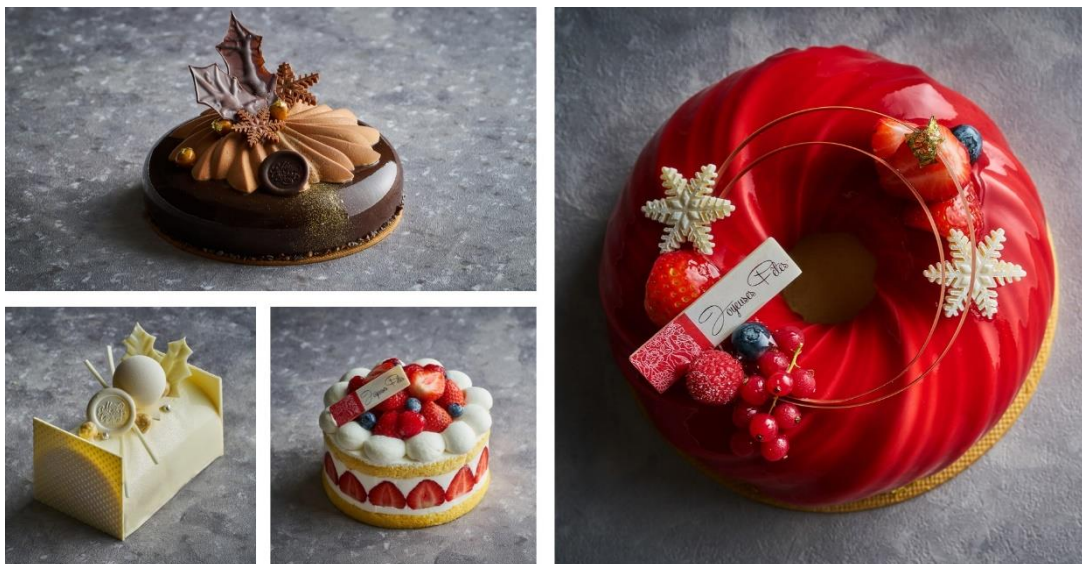
品川プリンスホテルで販売する4種類のクリスマスケーキ

心華やぐホリデーシーズンに、バリエーション豊かなクリスマスケーキが煌びやかな時間を演出いたします。