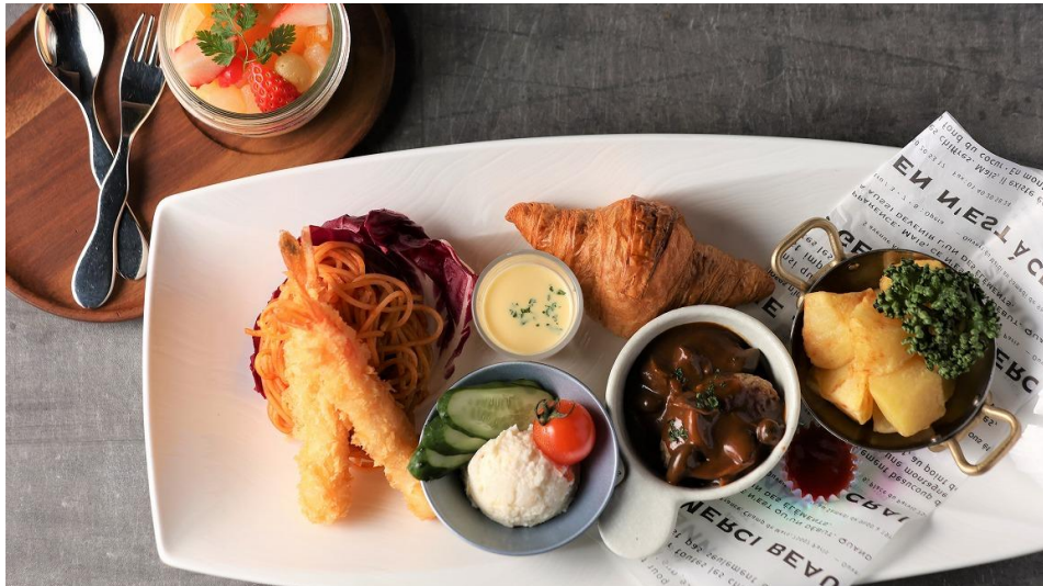
お子さまプレート ¥2,000 Kids Plate