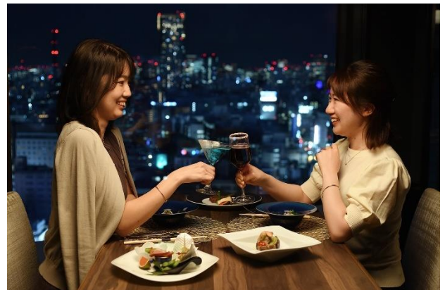
※ディナーコース利用イメージ