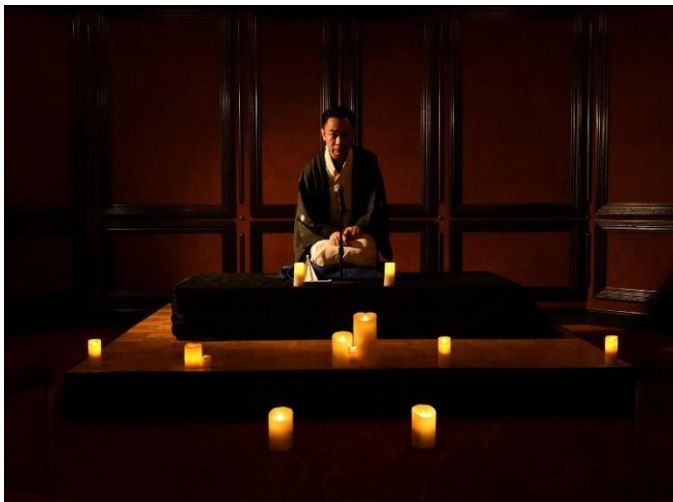
※怪しい雰囲気を出した怪談ナイト (イメージ)