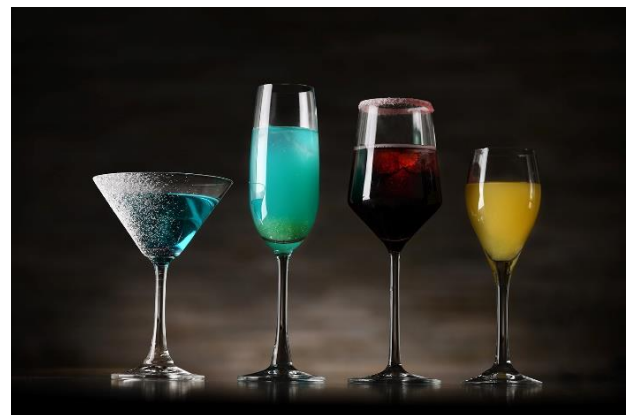
※怪しげな雰囲気をイメージしたウェルカムドリンク (イメージ)