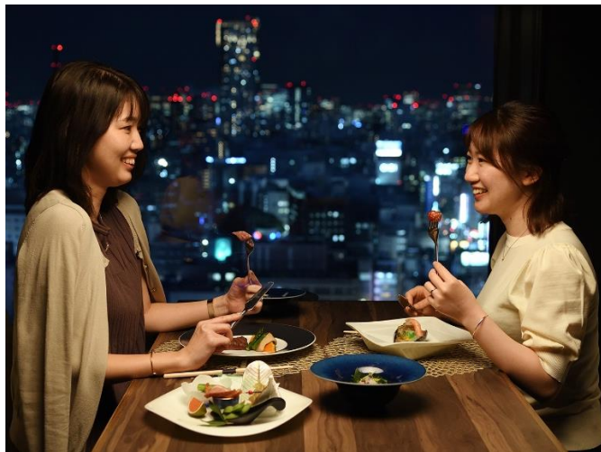
※ディナーコースご利用イメージ