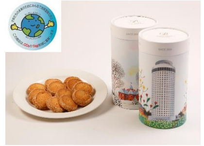
ホテルオリジナル「タワークッキー」