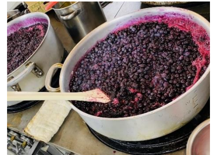
自家製ジャムの仕込み風景