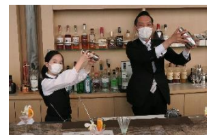
バーテンダー体験(イメージ)