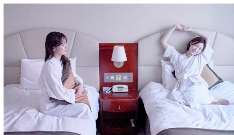
客室のイメージ (デラックスツインルーム)