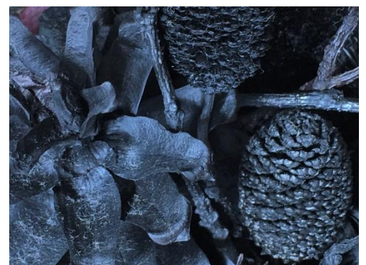
花炭完成イメージ