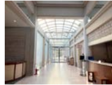
バンケットホール七里ガ浜の玄関に向かって進みます