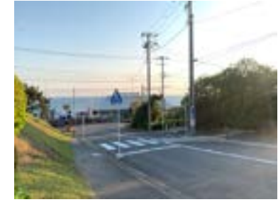
玄関を出て左に進むと踏切が見えます