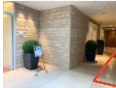
斜行エレベーターを降りたら右へ