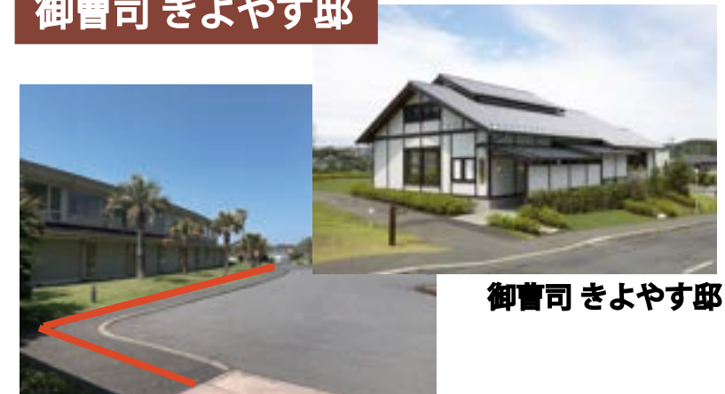
御曹司 きよやす邸