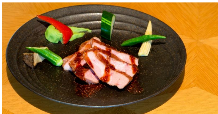
Pan-Seared Japanese Pork Shoulder Loin with Mustard Sauce