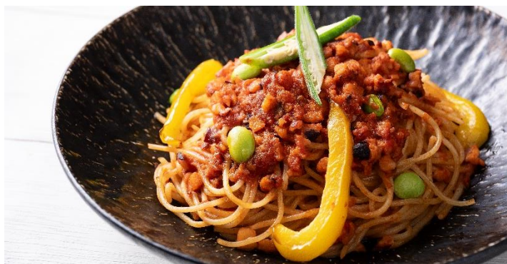
Octopus Ragu Spaghetti