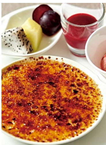
クレームブリュレ Crème brûlée

*表記料金には、消費税が含まれております。別途13%のサービス料を加算させていただきます。*写真はイメージです。