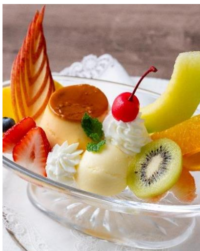
プリンアラモード Pudding a la mode