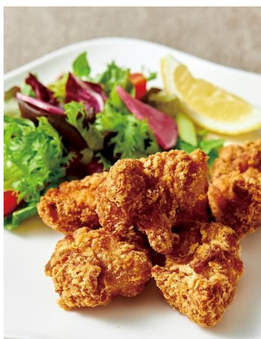
フライドチキン Fried Chicken