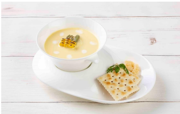
とろもろこしの冷製ポタージュ Chilled Sweet Corn Potage