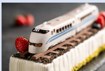
「新幹線のぞみ」コラボレーションスイーツ