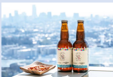
横浜ビールコラボレーションステイプラン