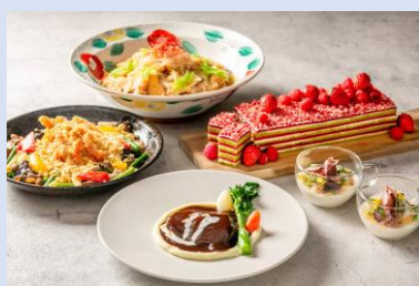
料理長スペシャルメニュー