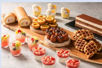
30 年間の流行スイーツ