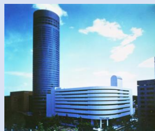
開業 30 周年アニバーサリー パネル展