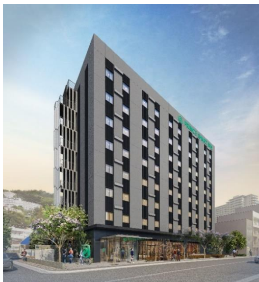
プリンス スマート イン 熱海 (イメージ)

近年、若年層を中心に再び人気観光地として注目を集める熱海において、この「プリンス スマート イン 熱海」が新たな熱海の拠点となり、熱海観光のさらなる発展に寄与してまいります。