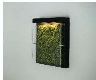
スカンディアモス