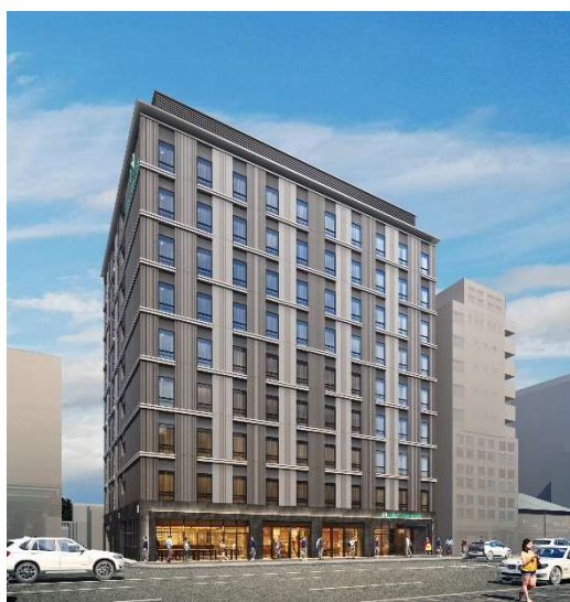
ホテル外観イメージ