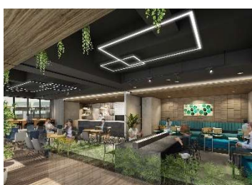
ホテル1階イメージ