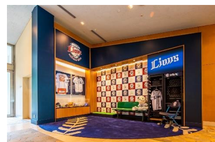
ディスプレイコーナー

お客さまをお迎えするロビーにおいて、フォトスポットを新設、会見パネルを設置しました。ヒーローインタビューを再現したSNS映えする写真を撮ることができます。さらにディスプレイコーナーを設置し、選手が実際に使用していた野球用具を展示しています