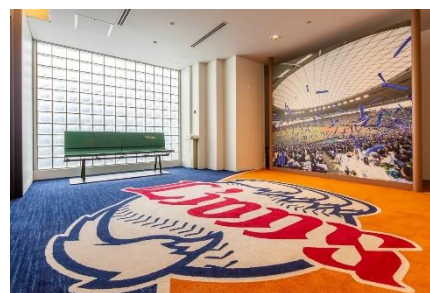
7階エレベーターホール

正面壁面にメットライフドームのパネルを設置し、球場にたどり着いたかのような熱気と臨場感を演出いたします。また、選手が使用していた実物のベンチを設置し、フォトスポット化することにより、ホテルにいながら球場にいるかのような感覚を味わうことができます。