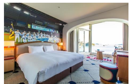
7階客室【ダブルルーム】