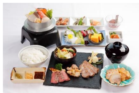
ライオンズスペシャルディナー