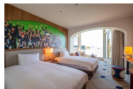
7階客室【ツインルーム】