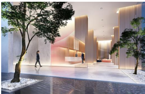
ロビーエリア(イメージ)