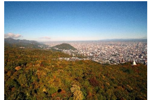
藻岩山からの札幌市内

web サイト: https://www.princehotels.co.jp/sapporo/