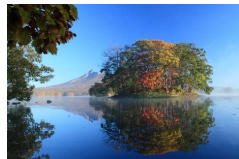
大沼国立公園(大沼湖畔)

web サイト: https://www.princehotels.co.jp/hakodate/