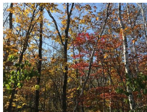
釧路湿原(温根内木道)

web サイト: https://www.princehotels.co.jp/kushiro/