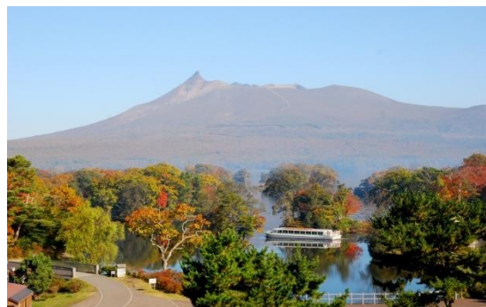
大沼国定公園の紅葉を楽しむなら遊覧船がおすすめ