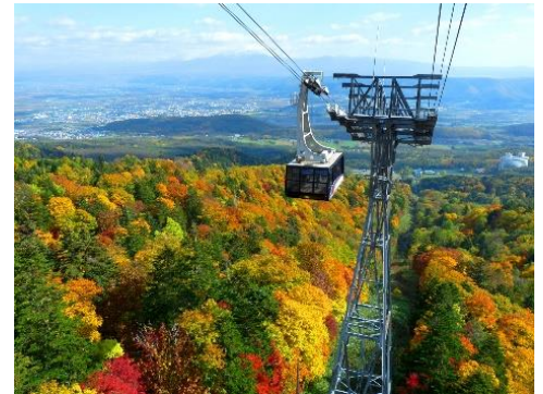
富良野ロープウェイ

web サイト: https://www.princehotels.co.jp/shinfurano/