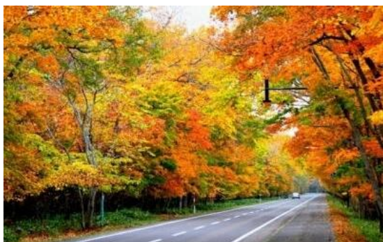
屈斜路湖摩周湖畔線(弟子屈町内)