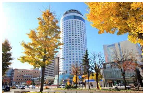
札幌市内の街路樹も色鮮やかに染まります

◎本件に関する報道各位からのお問合せ 株式会社プリンスホテル 北海道エリアマーケティング TEL:011-241-1114(札幌プリンスホテル内) https://www.princehotels.co.jp/hokkaido-area/