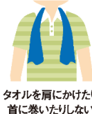
タオルを肩にかけたり 首に巻いたりしない