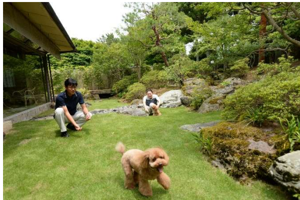
ワンちゃんと宿泊できるプランを4施設で販売

◎本件に関する報道各位からのお問合せ 株式会社プリンスホテル 広報部 TEL:03-6709-3302 FAX:03-6709-3400