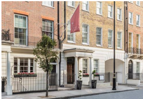
英国特有のジョージアン様式を 楽しめるホテル外観

ホテルは、ロンドンを拠点とするインテリアおよびブランディングデザイン会社の B3 Designers によって設計されました。客室は、お客さまがリラックスできるような柔らかさを醸し出す空間に設計されています。またホテル各所に設置されている家具は、シンプルで自然の素材を生かした、日本らしさを意識したデザインのものを使用しています。今回の賞では、英国の伝統的なジョージアン様式の建物を活かしながら、日本の高級感や静寂、またおもてなしの心が感じられるデザインが、他にはないオリジナリティのあるホテルとして評価されました。