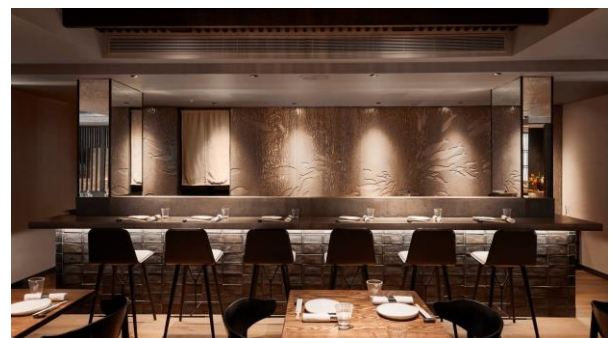
レストラン「TOKii」内の寿司カウンター