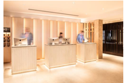
自然の木目調が落ち着いた雰囲気 のレセプション