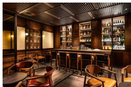
夜の「The Malt Bar & Lounge」 日本の貴重なウイスキーも並ぶ