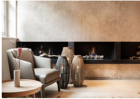
自然光と自然素材のオブジェが 明るさを演出しているロビー