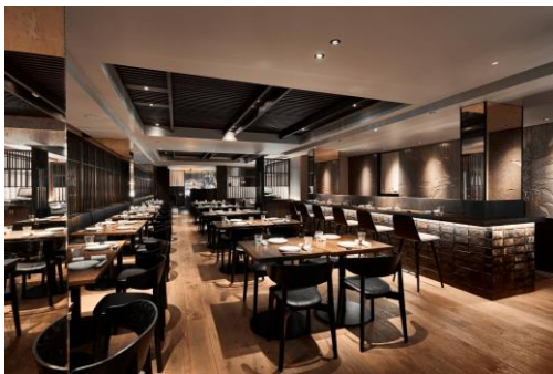
格子窓を意識した窓際のデザインが日本の 雰囲気を演出しているレストラン「TOKii」