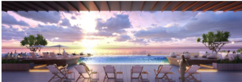
屋外プール(2F) イメージ