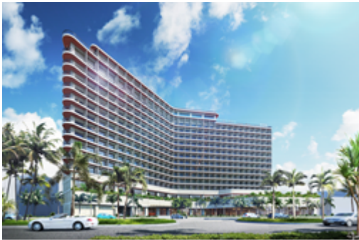
ホテル外観 イメージ

沖縄最大級のヨットハーバー「宜野湾港マリーナ」に面し、コンサートやプロ野球キャンプで有名な「ぎのわん海浜公園」、当社と同じ西武グループの西武造園株式会社も運営に携わる海水浴が楽しめる「宜野湾トロピカルビーチ」へも徒歩圏内と、マリンレジャーに最適な場所に位置します。さらにホテル至近に国際会議やコンサートが開催可能な「沖縄コンベンションセンター」が位置し、観光需要に加えリゾート MICE としても賑わいを創出するエリアです。ホテルは地上14階、340室の全客室がオーシャンビューで、レストラン、クラブラウンジを有し、水平線と一体となり、サンセットも楽しめるインフィニティープールを屋上と2階に設置いたします。その他スパ、フィットネス、大浴場、岩盤浴を設置し、心身ともにリラックスできるホテルを目指してまいります。