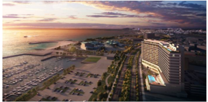
ホテル鳥観図 イメージ