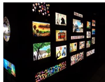
小さな祈りの影絵展(イメージ)

(※)アースアワーとは WWF が主催する世界中で同じ日・同じ時刻に消灯することで地球温暖化防止と環境保全の意志を示す、世界最大級のソーシャルグッドプロジェクトです。