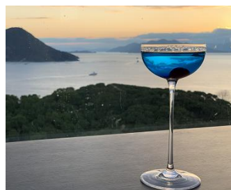
オリジナルカクテル(イメージ)