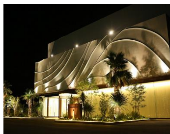
婚礼施設点灯時(イメージ)