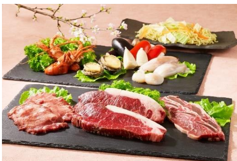
夜桜和牛サーロイン&シーフードバーベキューセット

【内容】和牛サーロイン(180g)／米国産牛骨付きカルビ／米国産牛タン／伊勢海老(外国産)／鮑 帆立貝／烏賊／焼き野菜(エリンギ・パプリカ・茄子・筍)／焼きそば／飲み放題(2時間制)