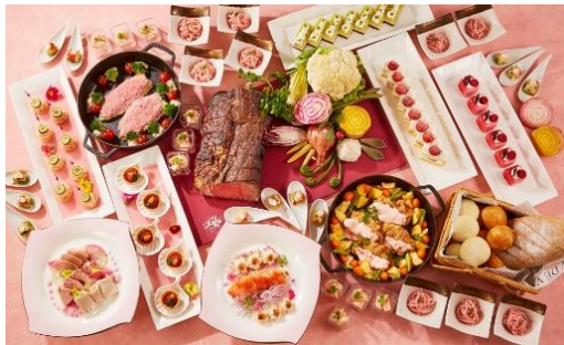
桜まつりディナーbuffet

【料金】ランチ 平日:¥3,800 土・休日:¥4,300 ディナー 平日:¥6,300 土・休日:¥7,000