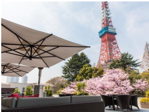
「カフェ&amp;バー タワービューテラス」

※ビアレストラン ガーデンアイランドは TEL:03-3432-1129(10:00A.M.～6:00P.M.)