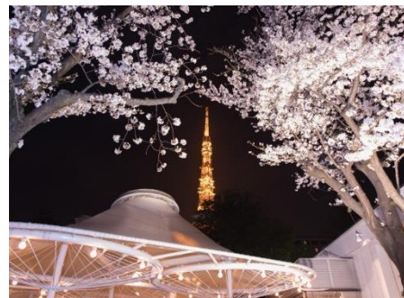
「ビアレストラン ガーデンアイランド」から望む桜と東京タワー