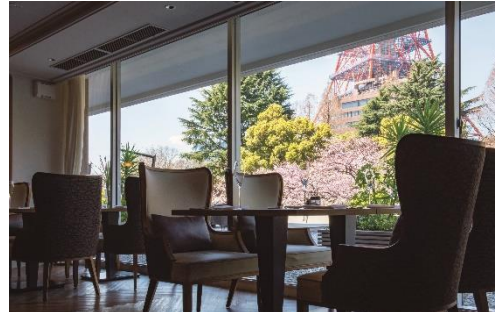
「buffetダイニング ポルト」から望む桜と東京タワー