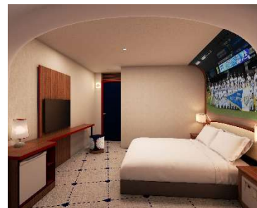
7階客室【ダブルルーム】(イメージ)