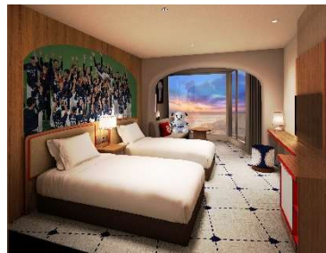
7階客室【ツインルーム】(イメージ)

全 84 室の客室のうち、7 階の 1 フロア (ツインルーム 11 部屋、ダブルルーム 1 部屋) を改装いたします。壁紙、絨毯、カーテンや寝具、テレビ等の改装に加え、「埼玉西武ライオンズ」をコンセプトとし、勝利時の熱気を表現した壁紙、等身大パネルや「レオ人形」等、さまざまな装飾を部屋のアクセントに施します。