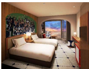
ライオンズルーム(イメージ)

また、宮崎県日南市は、埼玉西武ライオンズの秋季・春季キャンプ地として、街を挙げて応援してきました。南郷スタジアムや南郷駅の他、今年2月の史上初の水上パレードが行われた目井津港、キャンプイン時に球場で神主によって行われる安全祈願を執り行う よわら 榎原神社等、埼玉西武ライオンズゆかりの地が数多くあります。プリンスホテルでは、日南市や南郷町との相互連携を強化し、一体となって埼玉西武ライオンズを応援し、日南市南郷町全体の魅力向上に寄与してまいります。