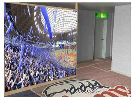
7階エレベーターホール(イメージ)

正面壁面にメットライフドームのパネルを設置し、球場にたどり着いたかのような熱気と臨場感を演出いたします。また、選手が使用していた実物のベンチを設置し、フォトスポット化することで、ホテルにいながら球場にいるかのような感覚を味わうことができます。