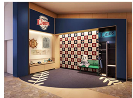
ディスプレイコーナー(イメージ)

お客さまをお迎えするロビーにおいて、フォトスポットを新設いたします。会見パネルを設置し、ヒーローインタビューを再現した SNS 映えする写真を撮ることができます。さらにディスプレイコーナーを設置し、選手が実際に使用していた野球用具の展示を行います。