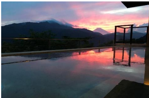
龍宮殿本館 女性用露天風呂からの夕景

【特典】「絶景日帰り温泉 龍宮殿本館」ご入浴・参加者全員に星座早見盤をプレゼントいたします。