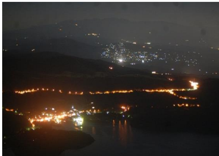
駒ヶ岳山頂から見える夜景