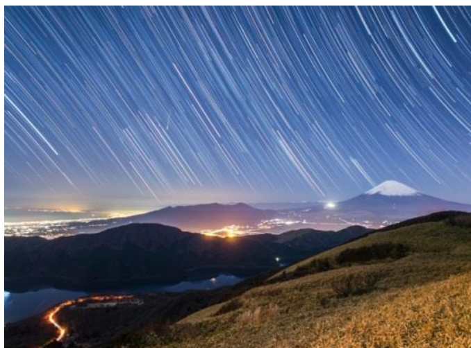
駒ヶ岳山頂から見える星空と富士山

夜のアクティビティーとして星が綺麗に見えるこの時期に普段行わない夜間運行を行い、箱根の秋の新しい過ごし方をご提案いたします。