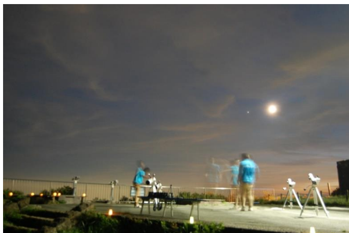
駒ヶ岳山頂天体観測イメージ