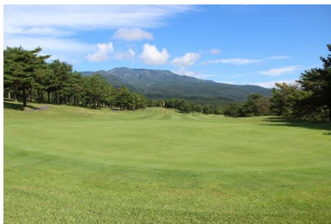
嬭恋高原ゴルフ場 9番ホール

秋の爽やかな空気の中、標高1,100mの起伏を巧みに生かしたゆるやかな高原に広がる18ホールで、浅間山・赤城山を望む雄大な眺望の嬭恋高原で爽快なプレーと嬭恋村が誇る秋キャベツをご自宅で味わっていただけます。