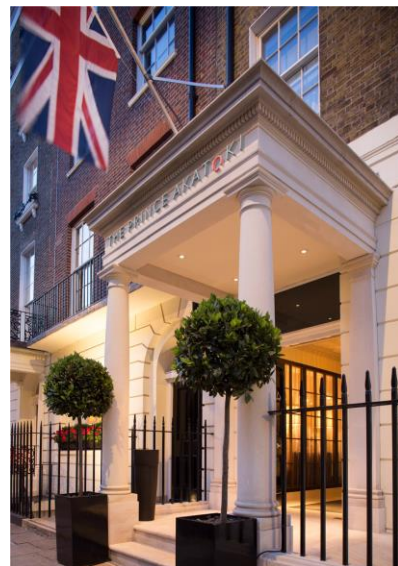
The Prince Akatoki London 外観イメージ

【その他の施設】 ラウンジ・バー、ミーティングルーム、シェアワークスペース、ジム 他