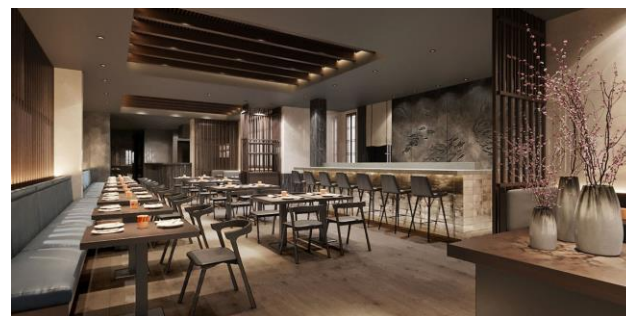
レストラン「Tokii」イメージ