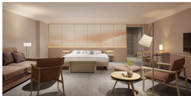
The Prince Akatoki London 客室イメージ

©本件に関する報道各位からのお問合せ 株式会社プリンスホテル 広報部 TEL:03-6709-3302 FAX:03-6709-3400