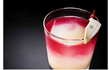
カクテルイメージ

※上記料金は、2019年10月1日(火)以降変更となりますので、あらかじめご了承ください。