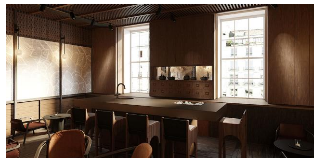
ティーラウンジ イメージ