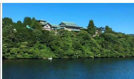
龍宮殿本館 外観(イメージ)