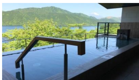
女性露天風呂(イメージ)

夏の温泉はイメージとして熱いと思われがちですが、水温を低く設定することで時間をかけ入浴ができ、温泉の効能も皮膚に吸収しやすくなります。施設の特徴の露天風呂からの絶景もゆっくりご覧いただけます。また、熱い温泉が苦手な方が多い外国人観光客にとっても温泉を楽しんでいただきやすくなります。