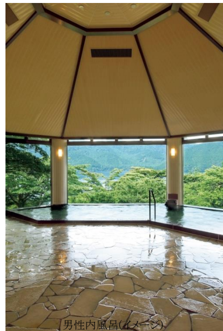
男性内風呂(イメージ)