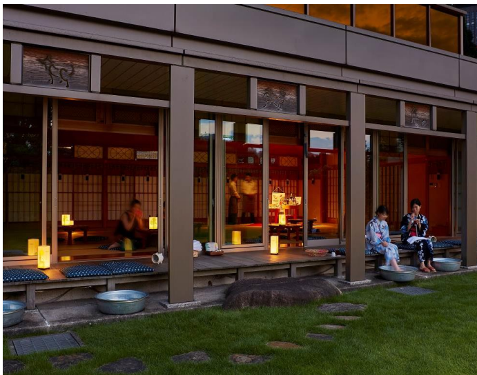
SUZUMUSHI CAFÉ 縁側 (イメージ)

今年は「令和」という新しい時代を迎えたことから、日本の伝統とともに新しさを感じていただける夕涼みを演出いたします。伝統的な夕涼み要素である、涼しげな鈴虫の音色や浴衣着付け等に加え、フォトジェニックなオリジナルフードやスイーツの販売、東京タワーを望む庭園に番傘を使用した照明を設置する等、現代らしい新たなコンテンツもご用意いたします。