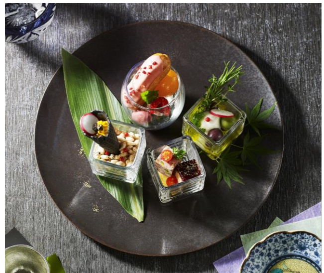
SUZUMUSHI CAFÉ ディッシュプレート (イメージ)