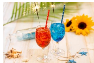
花火カクテル イメージ