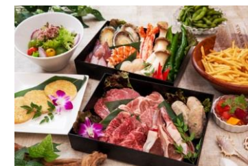
おとな「粋」バーベキューセット