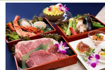
令和元年 神戸牛 2種バーベキューセット

フラップミート / タレ浸け牛フィレ / 国産豚肩ロース / アメリカ産牛ハラミ バジルチキン / 海老 / イカ串 / 餃子フランク / 万願寺唐辛子 パプリカ / エリンギ / 焼きおにぎり / 枝豆 / ポテト / サラダ / デザート