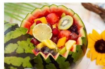
スイカ割りポンチ イメージ