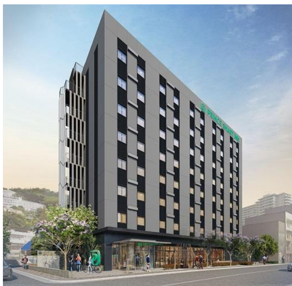
プリンス スマート イン 熱海 外観イメージ

「プリンス スマート イン」は、今後も首都圏のほか地方都市、新幹線停車駅や地方空港周辺都市などへの展開を進め、訪日外国人旅行者やデジタル世代の成長など、時代とともに変化するニーズに合わせ、既存の枠にとらわれないイノベティブな設備・サービスを通じて、お客さまに快適な滞在をご提供してまいります。