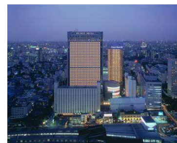
品川プリンスホテル

※上記内容はリリース時点(2018年8月16日)の情報であり、変更になる場合がございます。