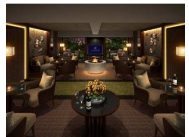
プライベートラウンジ (仮称) イメージ