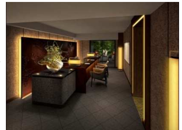
専用カウンター (仮称) イメージ

15F、16Fのクラブフロアにお泊りのお客さまが利用できるクラブラウンジを日本庭園に面した1Fに移設し、これまでの約4.5倍の100席に増やします。新設するテラス席やプライベートラウンジ(仮称)など5つのエリアを設けることで、利用シーンに合わせてご滞在いただけます。また、日本庭園からのエントランスや専用カウンターを設置により利便性も高めます。そして、スイートルームを2室増室することにより、エグゼクティブ需要に対応いたします。