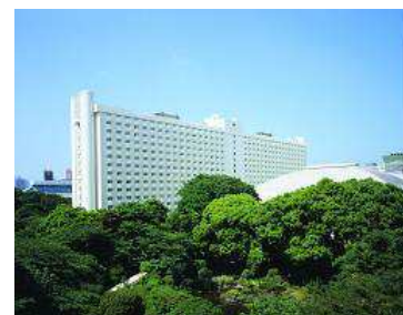
グランドプリンスホテル新高輪