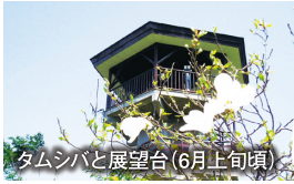
タムシバと展望台 (6月上旬頃)