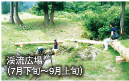
渓流広場 (7月下旬~9月上旬)