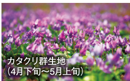
カタクリ群生地 (4月下旬~5月上旬)