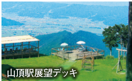
山頂駅展望デッキ