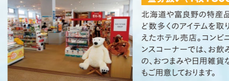
図 新富良野プリンスホテル / 7:00A.M.~11:00P.M. (物産コーナー8:00A.M.~10:00P.M.) ※差額返金はございません。