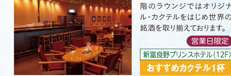
図 5:30P.M.~11:30P.M.(10:45P.M.ラストオーダー)