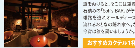
図 7:00P.M.~12:00MID. ※禁煙席はございません。 ※未成年者、お子さまご同伴の入店はお断りします。