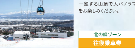
図 9:00A.M.~3:30P.M.または日没(12月下旬~3/21) ※別途キーカード保証料¥500をお預かりし、返却時にお返しします。