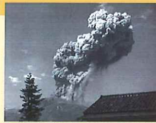
昭和33(1958)年12月14日の噴火による噴煙の様子

噴火した場合、火口から4km以内では、50cm程度までの大きな噴石(岩塊)が飛んでくる可能性があります。明治時代以降の噴火で犠牲になった方々は、全て火口から4km以内にいた登山者で、噴石(岩塊)の直撃を受けて亡くなっています。