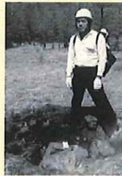
昭和58(1983)年4月8日の噴火で火口から飛来した直径約70cmの噴石。火口から約2kmの湯の平にて。