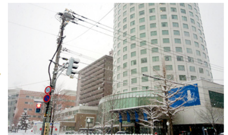
札幌プリンスホテルに到着です。ごゆっくりとおくつろぎください。