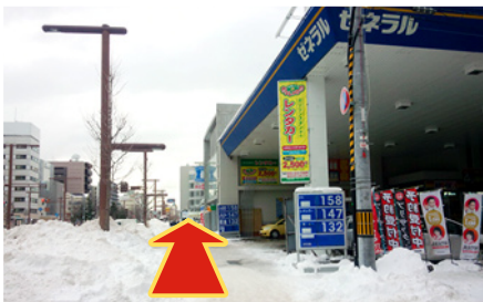
右手にガソリンスタンドが見えてきます。そのまま直進してください。