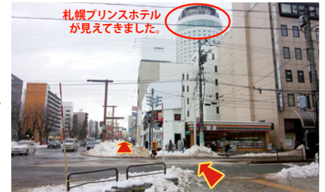
最初の交差点です。札幌プリンスホテルが正面に見えてきます。交差点を渡り、そのまま直進してください。