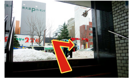
2番出口です。出口を出たら、右手にお進みください。