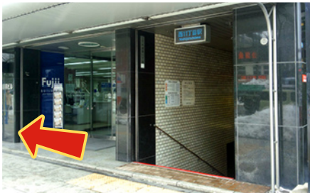
地下鉄東西線西11丁目駅2番出口を歩道から見た様子です。矢印の方向にお進みください。