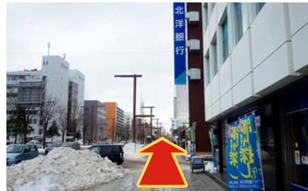
そのまま直進してください。