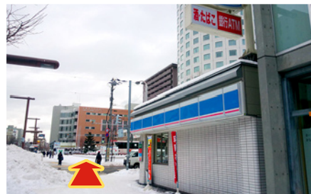
2回目の交差点を渡っていただくと、札幌プリンスホテルに、到着いたします。