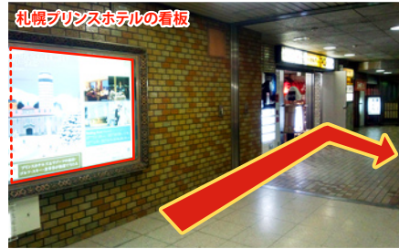
道なりに進むと、札幌プリンスホテルの看板があり、右手に表に出る階段がございます。そのままお進みください。