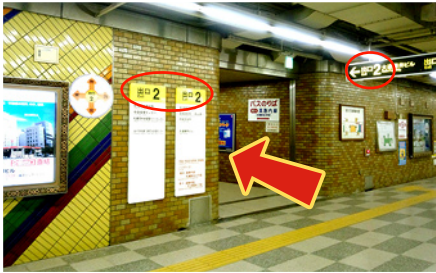
改札口を出て、2番出口に進みます。