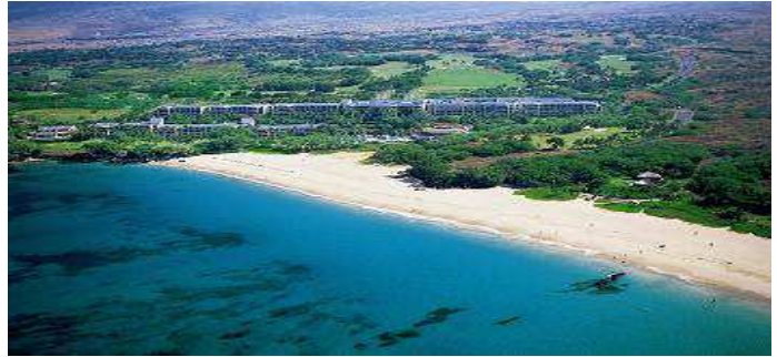
【ハプナビーチプリンスホテル全景】

また、大理石で囲まれたゆったりおくつろぎいただけるバスルームがあり、トイレ、シャワーブース、パウダールームがそれぞれ独立していることから、ファミリーやグループでのお客さまにもおすすめのホテルです。