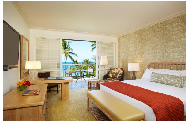
【ハプナビーチプリンスホテル新客室(イメージ)】

◎本件に関する報道各位からのお問合せ 株式会社プリンスホテル マーケティング部 TEL : 03-5928-1154 FAX : 03-5928-1514