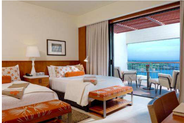
【2009年にリニューアルしたオーシャンビュー・デラックス】

マウナケアビーチホテルは2009年に、より魅力的なリゾートを目指すべく「メインタワー」の客室やレストランなどを改装し、同時にプリンスホテルズ&リゾーツのフラッグシップブランド「ザ・プリンス」の一員となりました。今回の改装では新たに85の客室をリニューアルし、更なる魅力向上を図りました。