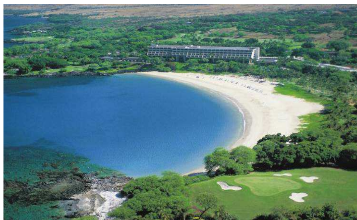
【マウナケアビーチホテル全景】

ロックフェラー氏が深く感銘を受け、リゾート開発のきっかけとなったカウナオア湾の白い三日月形のビーチや山頂の斜面から湧き水が流れる景観が美しいマウナケア山の間に位置するマウナケアビーチホテルはハワイ島の自然を満喫できるリゾートホテルとして、世界各国の上質な滞在を追求する個人のお客さまなどからご利用いただいております。