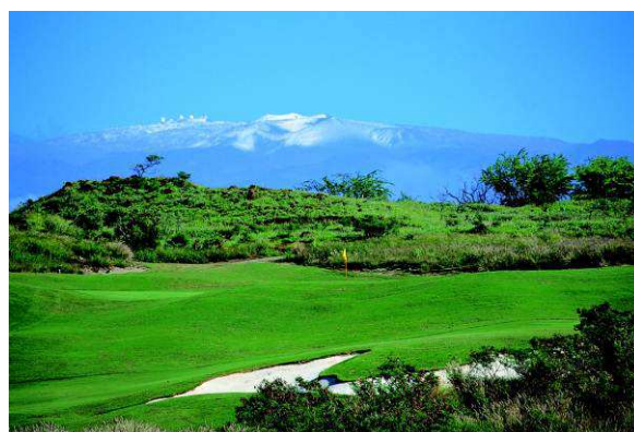
【ハプナゴルフコース】

お問い合わせ・ご予約は プリンスホテル予約センター TEL:0120-00-8686 にて承ります。