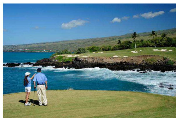
【マウナケアゴルフコース】

その他施設:マウナケアゴルフコース、シーサイドテニスクラブ、フィットネスセンター、プール/ジャグジー