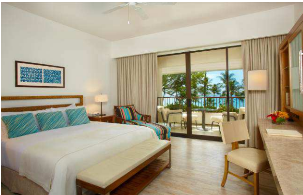
【マウナケアビーチホテル新客室(イメージ)】

「マウナケアビーチホテル」は 2013 年 12 月中、「ハプナビーチプリンスホテル」は 2014 年 1 月下旬にリニューアルを完了する予定です。