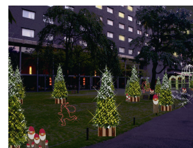
グランドプリンスホテル新高輪