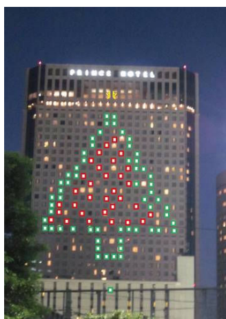
イルミネーション イメージ

カップルはもちろん、今年はお孫さんと過ごす三世代ご家族や女性同士のグループなど、それぞれ大切な人と過ごす時間を演出するイベントを多数ご用意しております。