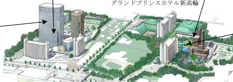
品川プリンスホテル