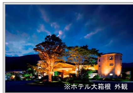
※ホテル大箱根 外観

【料 金】 1室3名利用時 1名さま ¥13,700より(夕朝食付) ¥8,700より(朝食付)