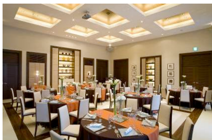
パーティールーム「アクトロ」