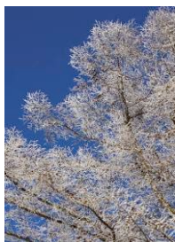
冬の軽井沢は晴天率90%以上

これは冬の結婚式の受注を目的とした初の取り組みで、結婚適齢期のカップルへ軽井沢の冬の結婚式の魅力を伝えるために実施いたします。凜とした空気、幻想的な景色は冬の晴天率90%以上の冬の軽井沢ならではの。白銀の世界に晴れ渡る青空、澄んだ空気のなか、ゲストハウスで大切な人たちと温かく美味しい料理を同じ空間で味わい、今まで以上に招待したゲストとの絆を深めることができます。結婚式の翌日にゲストと「軽井沢プリンスホテルスキー場」でスキーを楽しむことも冬の軽井沢だからこそ叶うウェディングの魅力です。「冬の軽井沢の結婚式をもっとロマンチックに」をコンセプトにした、冬の景色も寒さも冬の結婚式の魅力に変えることができる特典です。