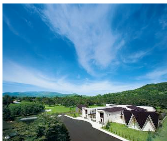
フォレスターナ軽井沢全景