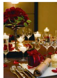
パーティールームは4会場