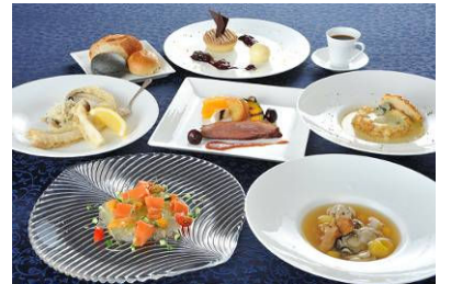
ポストン「旬祭ディナー」