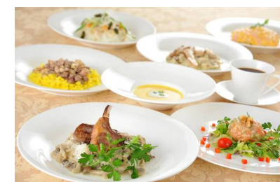
ポストン「秋のシェフランチ」

※仕入れ状況により、食材・メニューに変更がある場合がございます。※写真はイメージです。