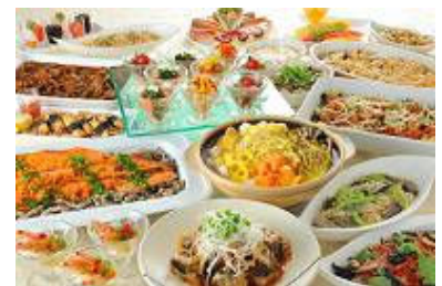
ポルト「旬のランチバイキング」