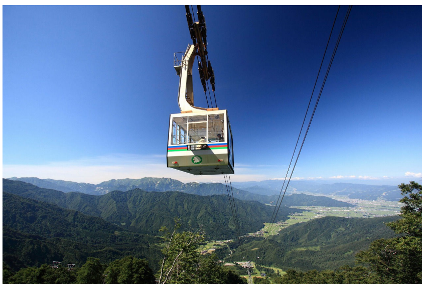
夏の八海山ロープウェーと魚沼平野

また夏の期間は、バーベキューやデイキャンプ体験など、夏休みのお子さまの楽しい思い出作りにも最適です。