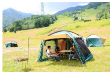
バーベキュー・デイキャンプ

◎本件に関する報道各位からのお問合せは 八海山ロープウェー(六日町八海山スキー場) TEL:025-775-3311 FAX:025-775-3173 http://www.princehotels.co.jp/amuse/hakkaisan