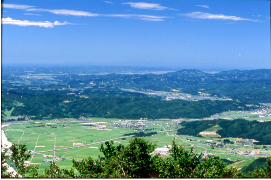
展望台からの眺望(佐渡島方面)

ロープウェイ山頂駅から約7分の展望台からは、周囲360度の大自然が広がり、越後平野や魚沼盆地・上信越国境の山々、そして快晴時には日本海や佐渡島も一望できる、全国でも屈指の好展望地です。