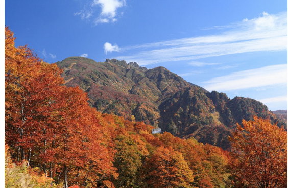
10月中旬からはじまる山々の紅葉