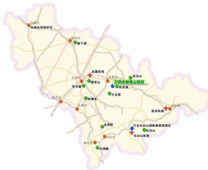
【吉林省内におけるプロジェクト地の位置】

プロジェクト地は吉林市内から 15km、長春龍嘉国際空港から約 90km、長春市内まで約 120km の場所です。吉林市は共用長吉高速鉄道を使用すれば長春龍嘉国際空港とは約 29 分、長春市とは約 40 分で結ばれており、国内外から容易にアクセス可能な環境が整っています。