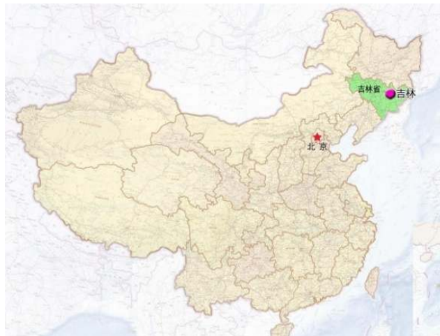
【中国国内における吉林省吉林市の位置】

国家名勝観光区の松花湖からわずか 5km のプロジェクト地でも四季折々の自然美をご堪能いただけます。