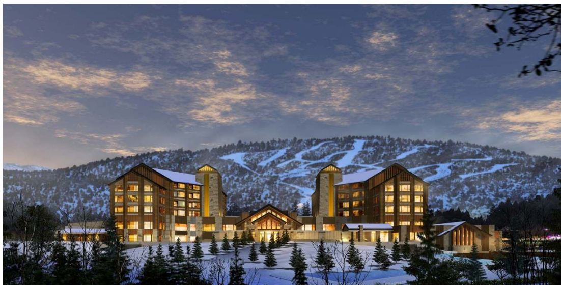
【ホテル・スキー場全景(イメージ)】

また、このプロジェクトへの参加は海外におけるプリンスホテルブランドの浸透を図ることによって、日本国内施設への誘客を強化する、インバウンド強化施策の一環としても捉えています。