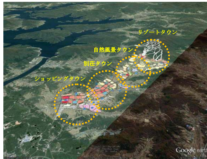
【吉林省松花湖国際リゾートエリア配置イメージ】

スキー場とホテルの運営は株式会社プリンスホテルの子会社である「吉林西武」が行い、日本の総合リゾートの運営で培ったきめ細やかなサービスの提供を行います。