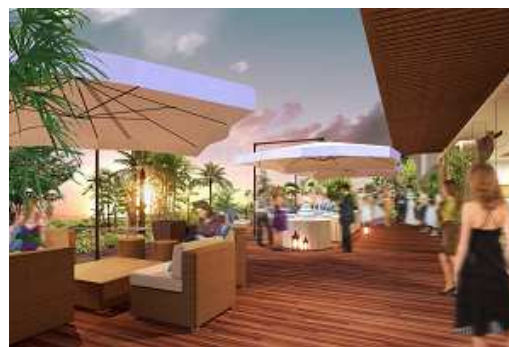
バンケットテラス(イメージ)