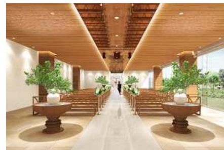
チャペル(イメージ)

挙式後には併設するガーデンでの写真撮影やフラワーシャワー、バルーンリリースなどアフターセレモニーもお楽しみいただけます。