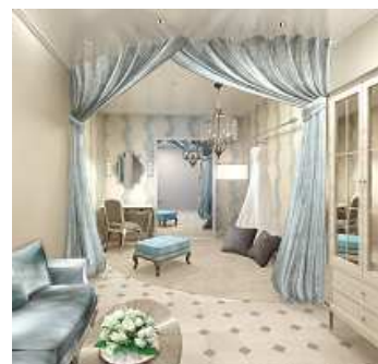
ブライズルーム(イメージ)

◎本件に関するお客さまからのお問合せ先は グランドプリンスホテル広島 ブライダルサロン TEL : 082-256-1111 (代表) http://www.princehotels.co.jp/hiroshima/