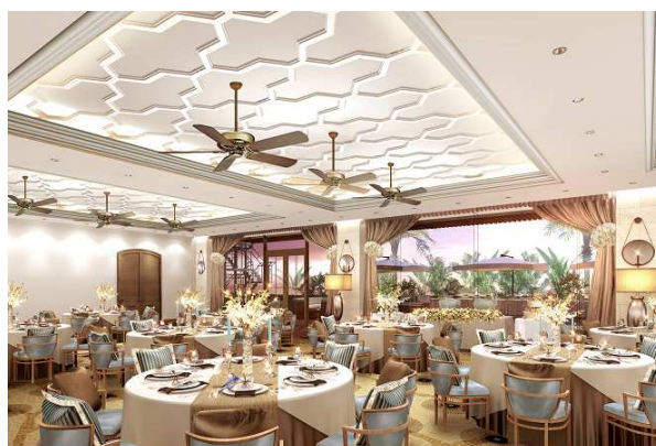
バンケット(イメージ)