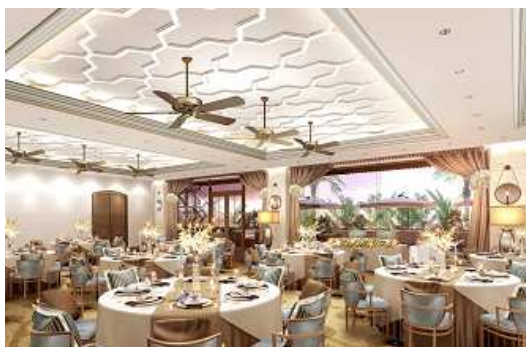
バンケット(イメージ)

併設のオープンテラスでは、デザートブッフェなどの演出でゲストとの歓談の時間もお楽しみいただけます。